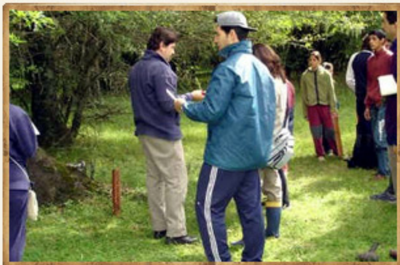
Sendero interpretativo de flora y avifauna