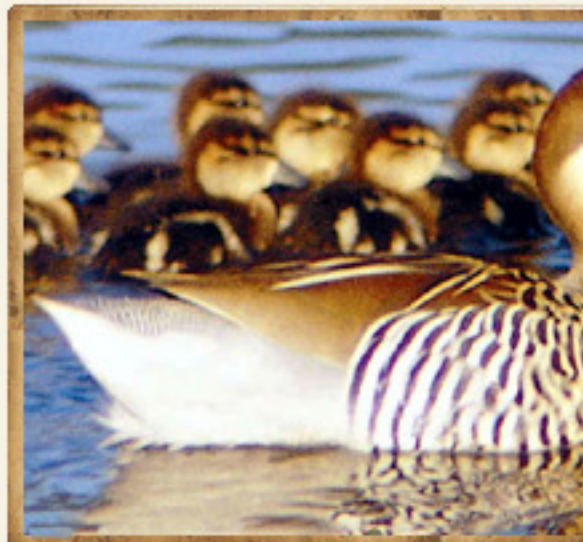
Pato Capuchino - Anas versicolor (G. Rocha)