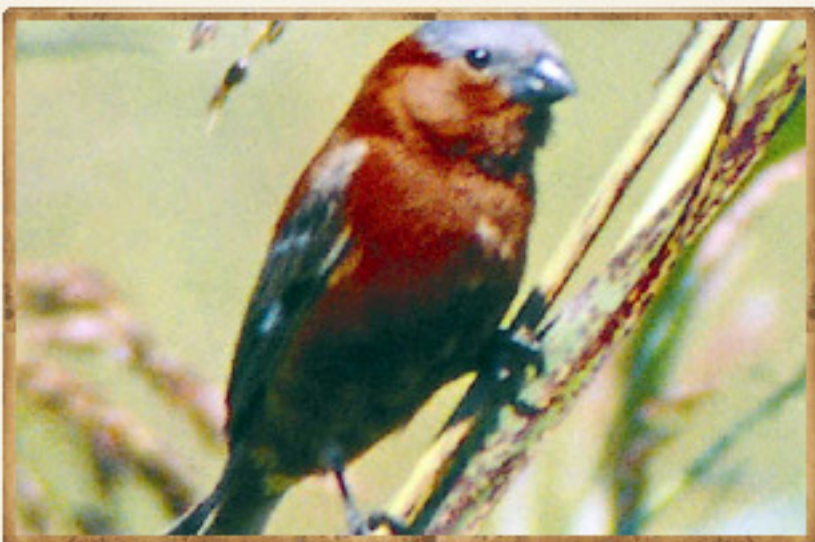
Capuchino Corona Gris - Sporophila cinnamomea (G. Rocha)