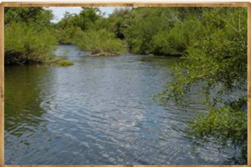
Río Queguay (G. Rocha)