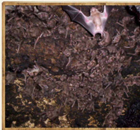
Cuevas y murciélagos